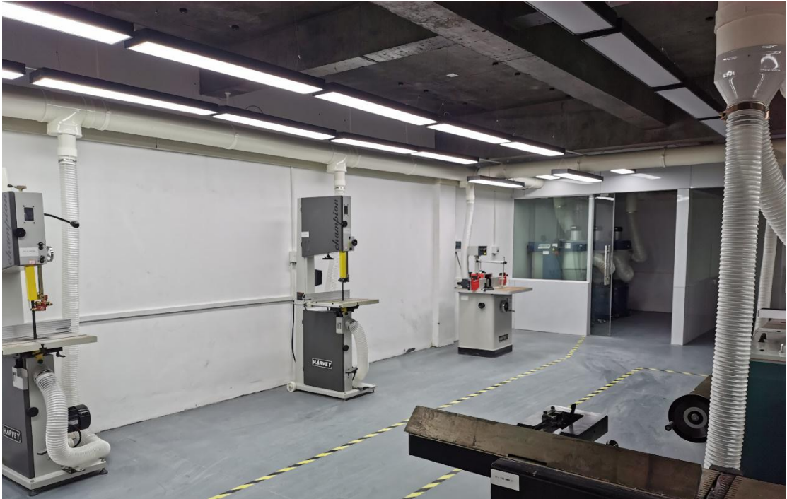
制胎生产加工车间