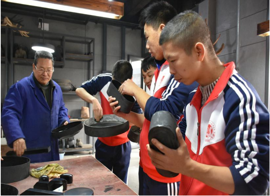
楚式漆器髹式技艺