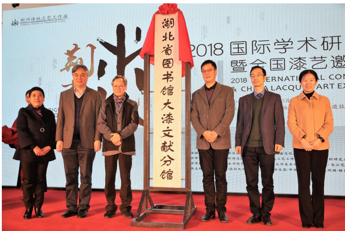
湖北省图书馆大漆文献分馆在工作站挂牌