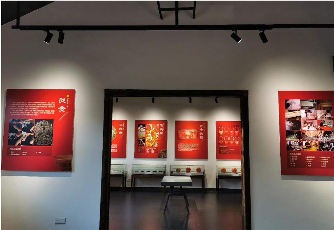
漆工艺馆髹饰展厅