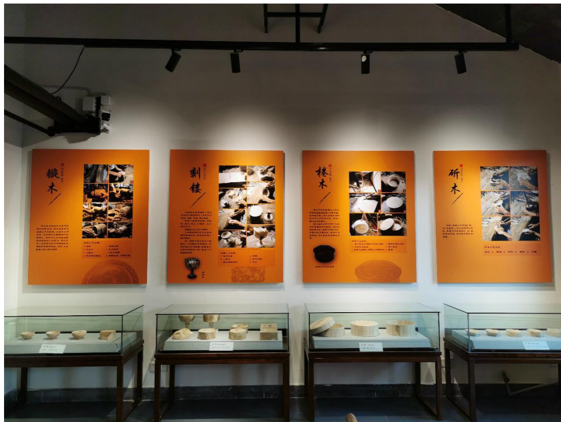
漆工艺馆胎体展厅