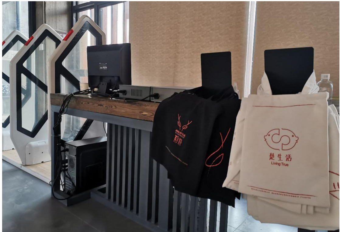
湖北省图书馆大漆文献分馆（荆州工作站）