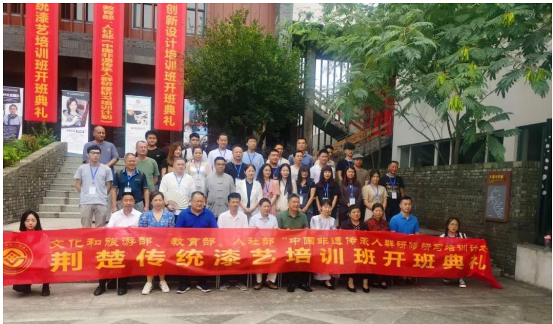
荆楚传统漆艺培训班合影

本次研培由文化和旅游部非物质文化遗产司作为指导单位，湖北省文化和旅游厅、荆州市文化和旅游局主办，长江艺术工程职业学院和荆州传统工艺工作站承办。清华大学美术学院提供技术支持。