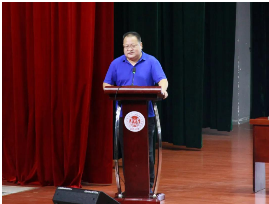
荆州市文化和旅游局局长刘宗彪