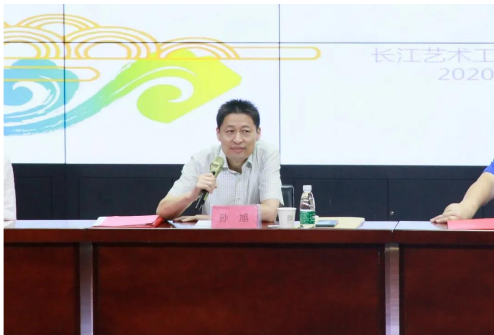
省文化和旅游厅非遗处处长孙旭出席仪式并讲话

7月25日上午，“2020年中国非物质文化遗产传承人群研修研习培训”活动——荆楚传统漆艺培训班、漆艺创新设计培训班开班典礼在我校荆河戏剧场举行。